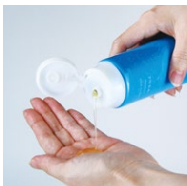
シャンプーを手にとる

プニア シャンプーを手のひらに取る時は、チューブをゆっくり傾けて手のひらに適量をお取りください。チューブを上向きに戻してからキャップを閉めてください。