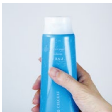
キャップを上にする